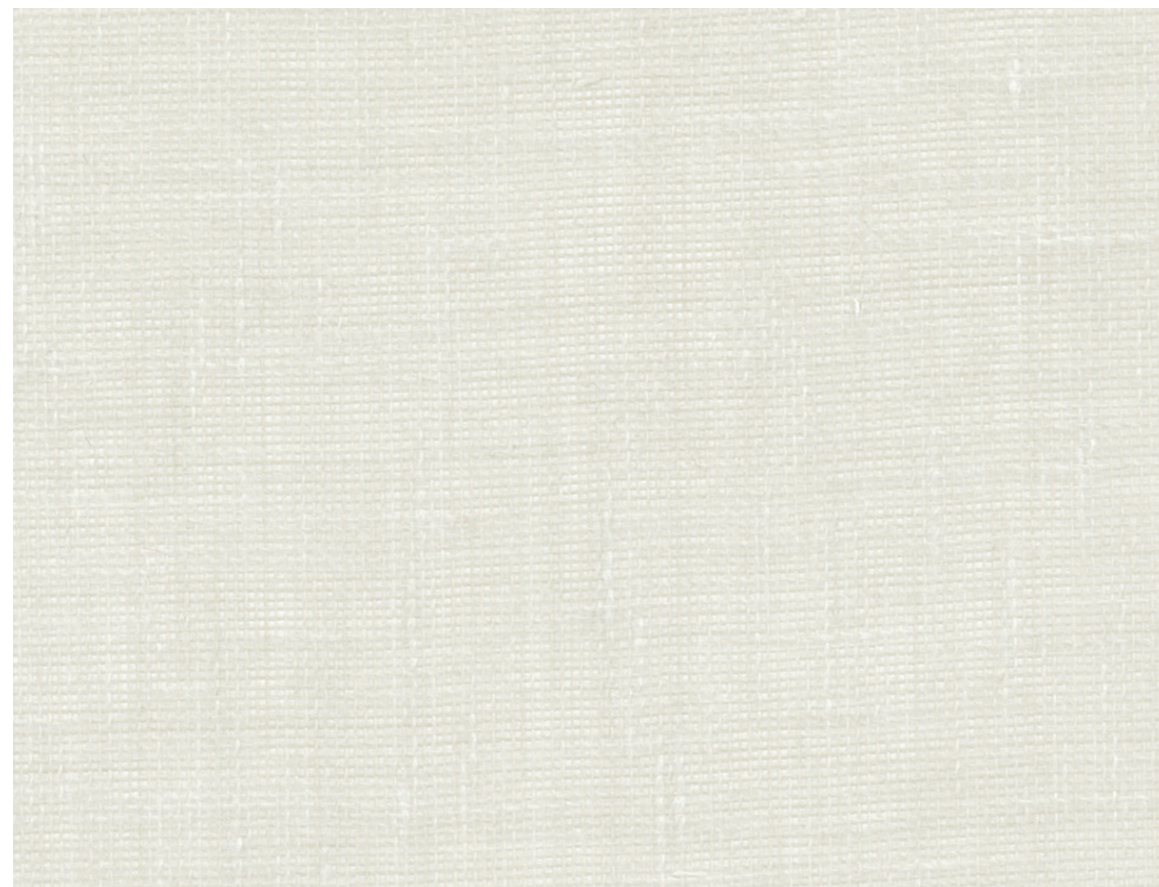
ETEL - 11 lin